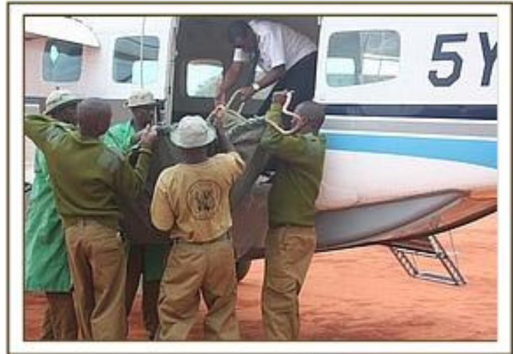
L'orfano e caricato nell' aeroplano dei recuperi 9/3/2009