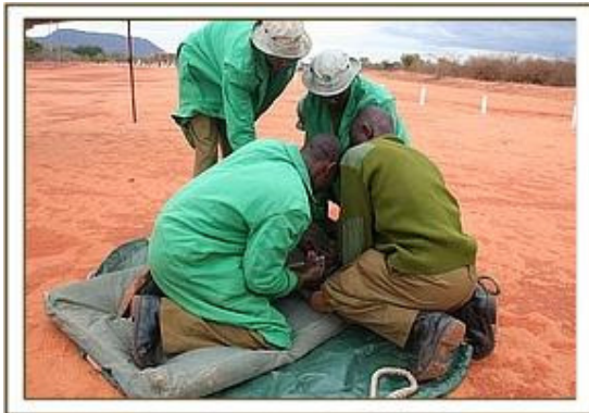
Abdi fa l'antibiotico all'orfano