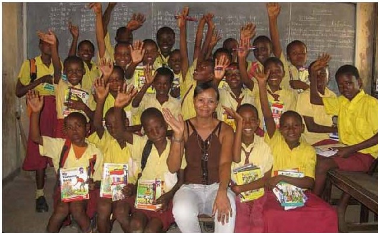
I mituns d'la Catholic Primary Schoole de Likaoni - Mombasa.

Sot a chësc titul s'è le Pengo Life Project (PLP) presentè al publich dla Val Badia, tla cornisc de na serada tl Hotel Posta Zirm a Corvara